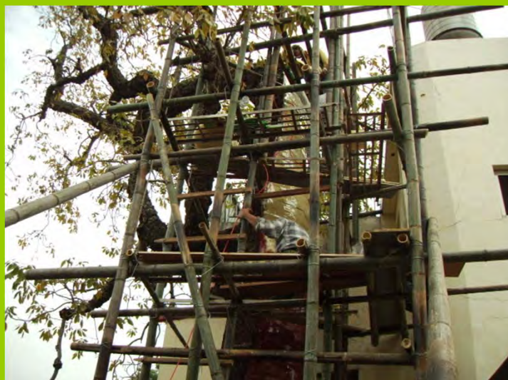
13.8公尺高填實發泡棉、木炭及覆上pvc人工皮、 噴灑藥劑