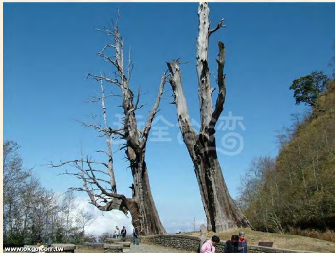
南投縣信義鄉-夫妻樹(兩棵紅檜巨木)