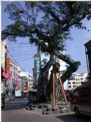
大甲鎮瀾宮褐根病防治後 以鋼構進行樹體支撐