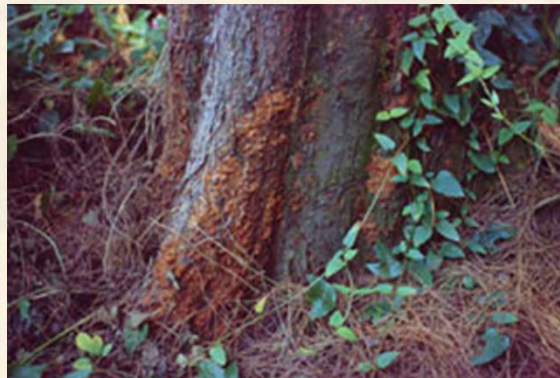
受 褐根腐 病菌為害之 木麻黃根部及地際

白蟻多在老樹之樹皮或莖幹基部外表築巢。此類白蟻以環家白蟻為代表，常發生在樟樹、榕樹等樹種。蟻巢分布與環境條件有關；溫暖處多，寒冷處少。性喜潮濕卻又怕多水，通風不良處多，空氣流暢處則少。如：南投市南崗之樟樹公遭白蟻為害，蟻巢均在南向近地面處，即是一例。應積極防治病蟲害，才能有效的保護老樹。