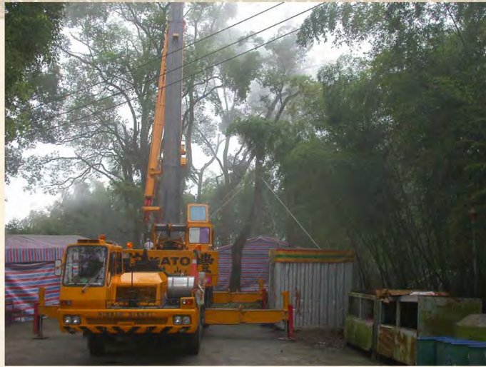
鳳凰茶園芳樟褐根病防治後 以鋼索進行樹體支撐