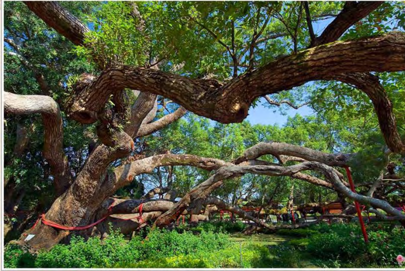
台中龍興村五福臨門神木 位於石岡鄉龍興村岡山巷一鄰三號附近，有一棵數百年的樟樹由相思樹、楠樹、楓樹、朴樹五棵樹合抱而成的巨樹，枝葉茂盛，樹冠高大，綠蔭寬廣。